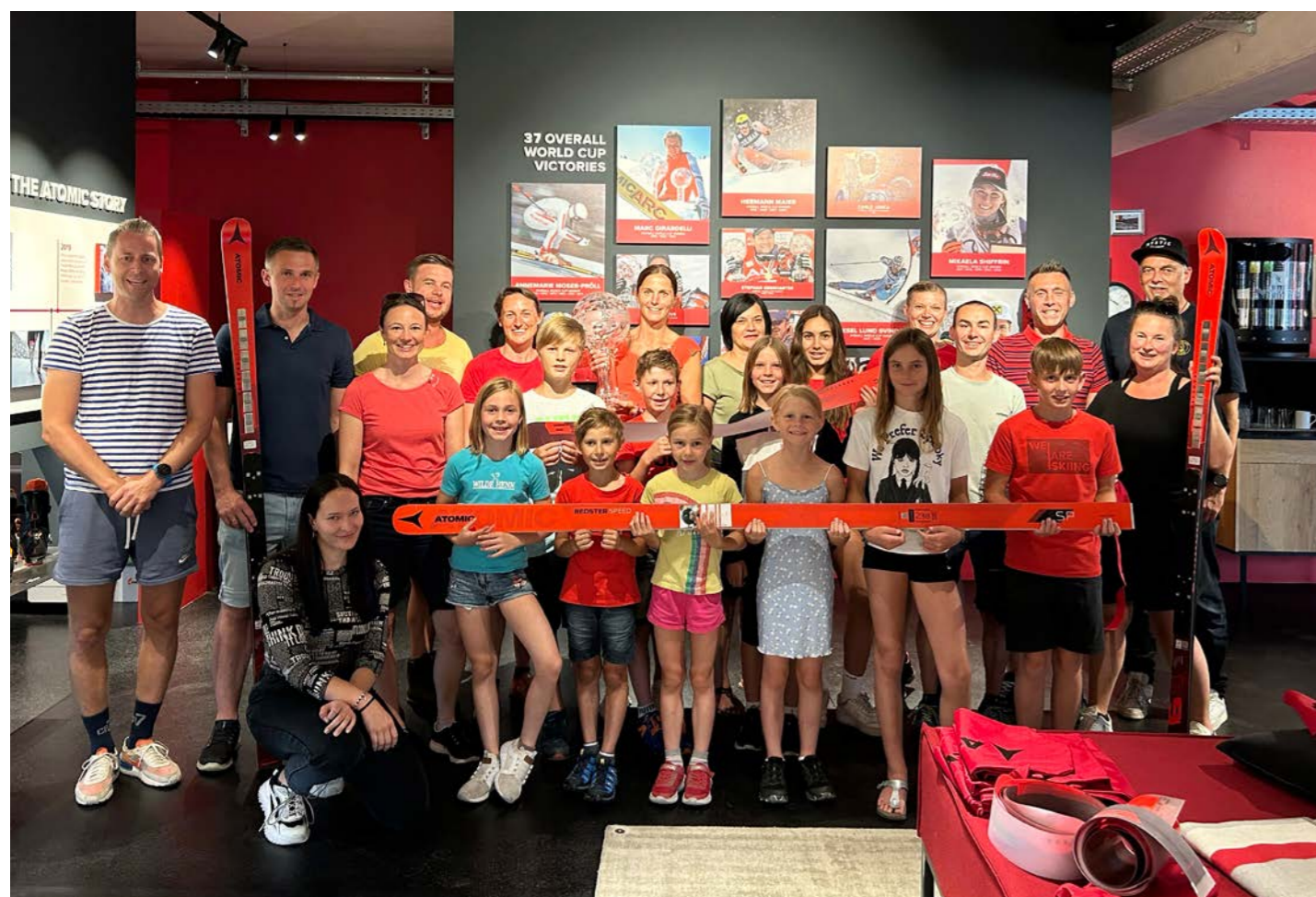
Spannende Einblicke bot die Werksbesichtigung bei Atomic

tenzzentrum für den Ski Alpin Nachwuchs. Neben sportlichen Aktivitäten kommt selbstverständlich die schulische Kompetenz nicht zu kurz. Speziell an die Anforderungen des Skisports angepasst wird die Schule mit Sport optimal koordiniert. Um die Kinder möglichst individuell betreuen zu können, sind in einer Schulkasse nicht mehr als 14 Kinder – im Sinne von einer Ganztageschule sind täglich Lern- und Hausübungsstunden eingeplant.