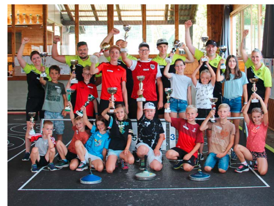
Freistädter Ferienpass: Gruppenfoto von der Siegerehrung

Schulen kein Ferienpass-Heft mehr aufgelegt wurde, was sich als nicht sehr zielführend herausstellte. Trotz der geringeren Teilnehmeranzahl verbrachten wir einen interessanten und lustigen Nachmittag mit