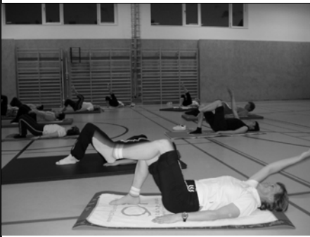
Den Damen machte das Training sichtlich Spaß