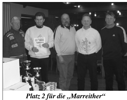
Platz 2 für die „Marreither“