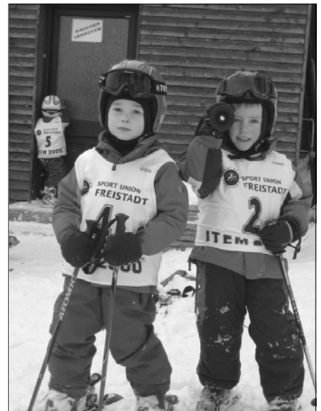
Bei den Kindern kam der Schikurs gut an

Auf der nächsten Seite präsentieren wir in aller Kürze die Veranstaltungshöhepunkte dieser Saison.