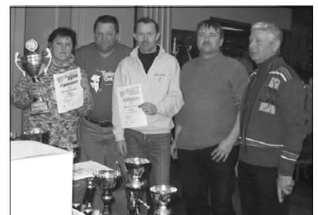
Den 3. Platz belegten „Foxi I“