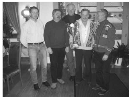
Platz 1 und somit Stadtmeister: „Hermis Jausencafe“

Nach zwei Spielen lagen die „Marreither“ vorne, doch konnten sie im Spiel gegen den „Seniorenbund“ nichts ausrichten. „Hermis Jausencafe“ hingegen entschied das dritte Spiel ganz klar für sich und erzielte somit eine hervorragende Quote. Schlussendlich konnte „Hermis Jausencafe“ den Stadtmeister für sich in Anspruch nehmen. Platz 2 ging an die Vorjahres-Stadtmeister „Marreither“. Den dritten Rang erkämpften sich „Foxi I“, die sich vor dem „Seniorenbund“ behaupten konnten.