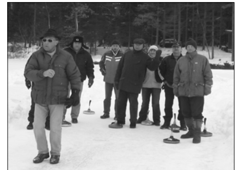
Der „Seniorenbund“ zeigte mit Platz 4 einmal mehr wie aktiv sie noch sind.