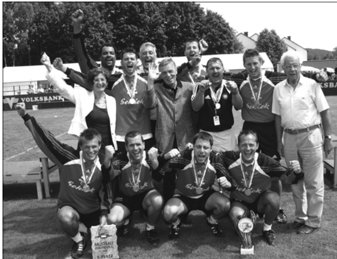
Solche Jubelposen wie beim Europapokalsieg 2005 werden wir hoffentlich heuer noch öfters sehen. Drei Mal besteht die Chance.

Die Frühjahrsmeisterschaft bietet für das Freistädter Publikum jede Menge Leckerbissen. Gleich fünf Heimspiele stehen am Programm, darunter Spitzenspiele gegen