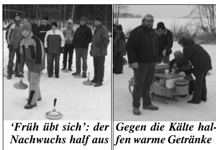
'Früh übt sich': der Nachwuchs half aus Gegen die Kälte halfen warme Getränke

In den vier Gruppen galt es wieder, jeweils einen Ersten zu ermitteln. Heuer konnten dies die Mannschaften von „Hermis Jausencafe“, „Marreither“, „Foxi I“ und „Seniorenbund“ für sich entscheiden. Somit standen die vier Mannschaften für das Finale fest.