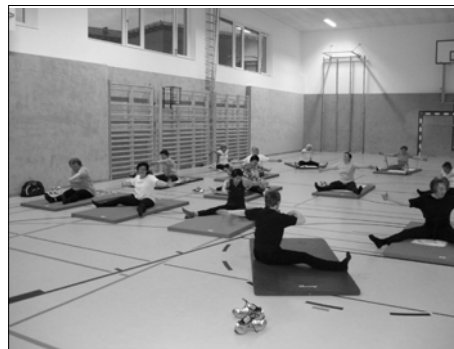
Auf die richtige Bewegung kommt es an

Pilates ist eine Form des Körpertrainings, das einen Ausgleich zu den einseitigen Bewegungen des Alltags schaffen soll und eine gleichmäßige Haltung des Körpers in den Mittelpunkt rückt. Basis aller Pilates-