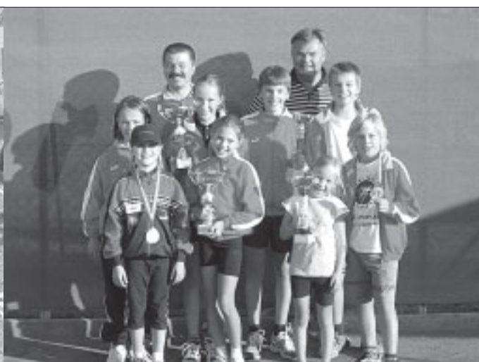
Die Nervosität am Start war unbegründet: Die Sport Union Freistadt räumte beim Grünbacher Geländelauf ordentlich ab.