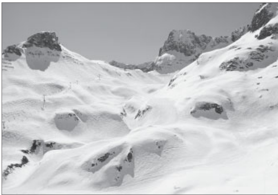
Schivergnügen im herrlichen Bergpanorama des Arlbergs ist beim Ski-Opening garantiert

Termin: 5. bis 8. Dezember 2003 Ort: St. Christoph am Arlberg Preis: 367 Euro für Erwachsene, Kinder bis Jahrgang 1988 zahlen 244 Euro. Dieser Preis umfasst Fahrt, Vollpension und den Drei-Tages-Schippass. Die Unterbringung erfolgt in der Bundesschiakademie in St. Christoph. Abfahrt: Freitag, 5. 12. um 15 Uhr bei Fa. Schick Rückfahrt: Montag, 8. 12. um 15 Uhr - Ankunft in Freistadt um ca. 19.30 Anmeldung: Anmeldung durch Einzahlung der Kosten bis spätestens 20.11.2003 auf Konto Nr. 11.010.113 bei der VKB-Bank (BLZ 18600)!