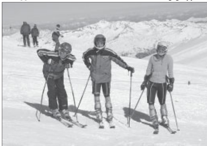
Traumhafte Trainingsbedingungen für den Rennkader.

Flautner möchte damit gezielt die tatsächlich am Rennsport interessierten Nachwuchsläufer fördern. Diese verkleinerte Trainingsgruppe hat heuer bereits fünf