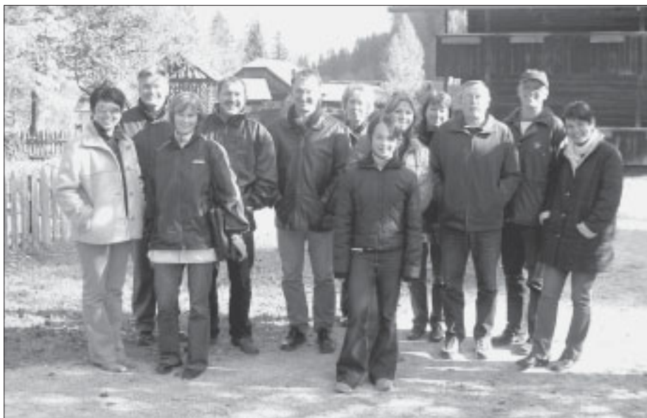
Begeistert waren die Freistädter vom Freilichtmuseum in Stübing.