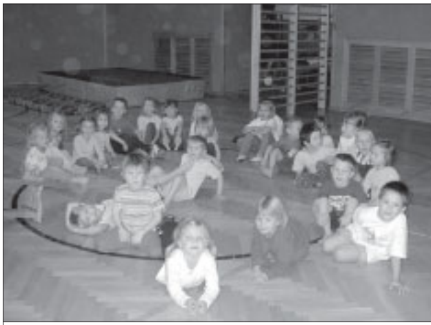
Die Kleinkindergruppe im HLA-Turnsaal