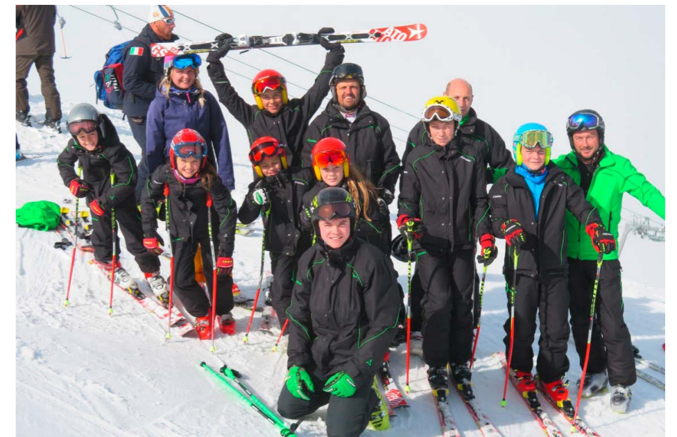
Bei perfekten Bedingungen konnte Mitte Oktober das erste Schneetraining der Saison absolviert werden.

Von 10.-12. Oktober 2014 fand das 1. Schneetraining und zugleich der Start in die neue Rennsaison 2014/15 statt. Im einzigen Ganzjahres-Skigebiet Österreichs auf bis zu 3250 Meter wedelten die Kinder, Trainer und Eltern nach der Sommerpause wieder erstmals die bestens präparierten Pisten hinunter. Bis der Winter auch im Mühlviertel Einzug hält, ist vorerst geplant neben den Hallentrainings alle zwei Wochen ein Schneetraining in verschiedenen Skigebieten durchzuführen. Die Reiteralm,