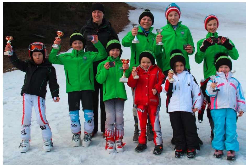
Beim Kidscup Sportzoo Roth/Atomic konnten die Freistadt Skilauf-Kids mit tollen Platzierungen aufwarten.