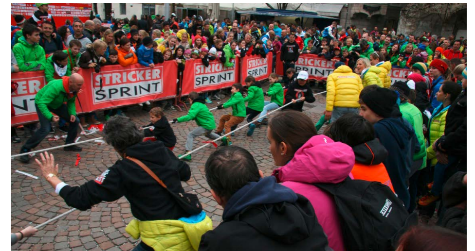
Die Rennläufer der Union Freistadt in Grün duellierten sich mit anderen Mannschaften im Seilziehen.