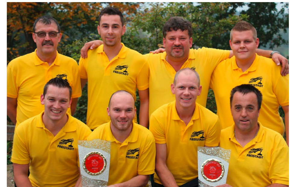
Zwei Mal Aufstieg in Freistadt: mit dem Team Freistadt 2 ist erstmals seit acht Jahren wieder eine Freistädter Stockschützenmannschaft in der höchsten Spielklasse des Sommercups vertreten. Freistadt 3 stieg mit einer Topleistung in die Klasse C auf.

fixieren. Der Stocksport der Sportunion Freistadt ist also im nächsten Meisterschaftsjahr in den Spielklassen A, C und E vertreten.