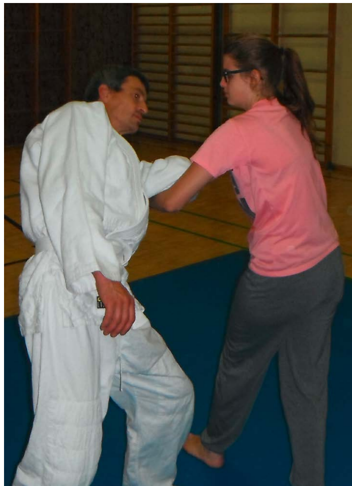
In der Sektion Aikido gibt es viele Neuigkeiten – für die beiden Abgänge gibt es aber auch fünf NeuanfängerInnen.