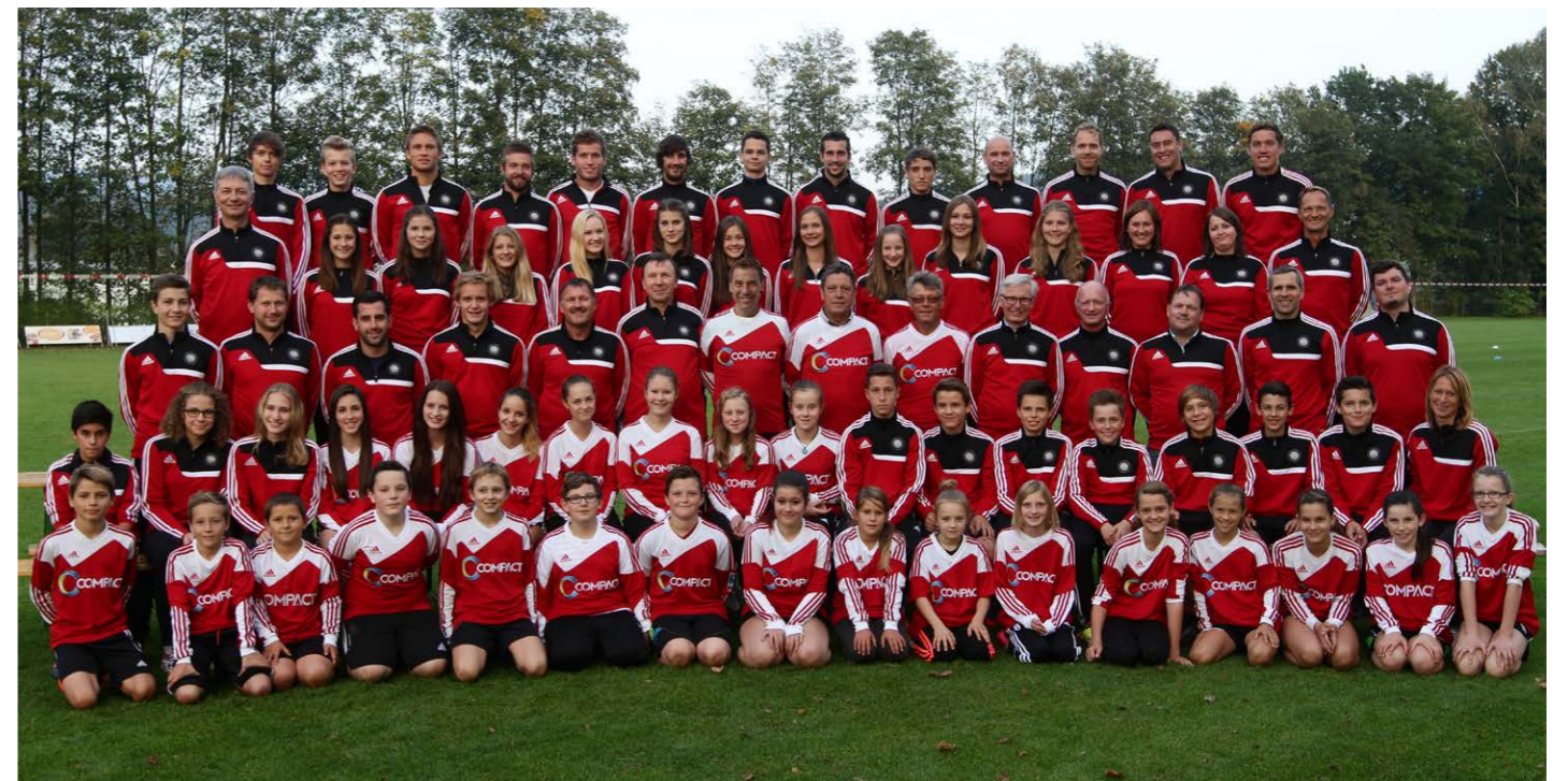
Die Sektion Faustball ist mit 80 aktiven Sportlern die größte Sektion der Sportunion Freistadt. Alleine der Nachwuchs beläuft sich auf 50 Sportler.